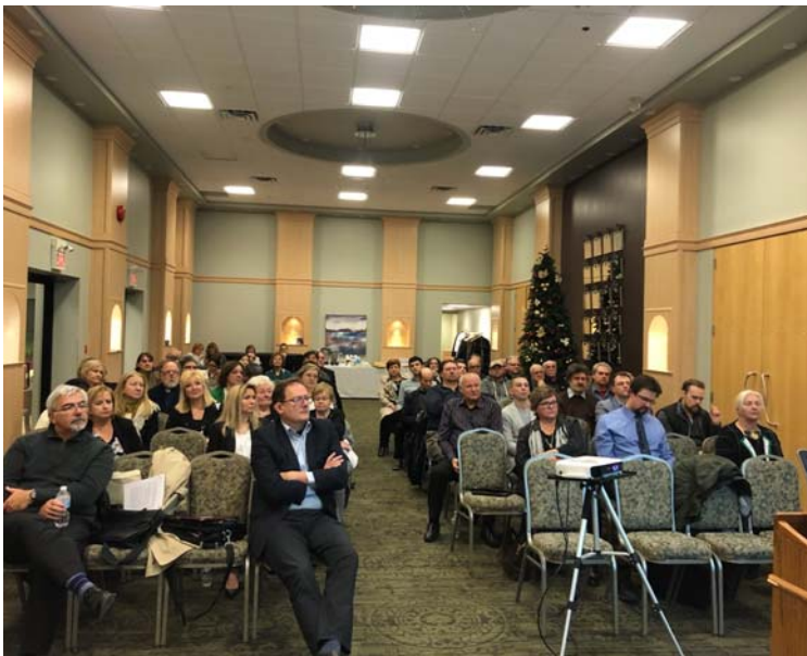
Ширші сходині КУК-Т із складовими організаціями

КУК Торонто неодноразово представляв українську громаду на різних зовнішньополітичних заходах, зокрема, під час зустрічі із новообраним Президентом України Володимиром Зеленським у ході його візиту в Канаду.