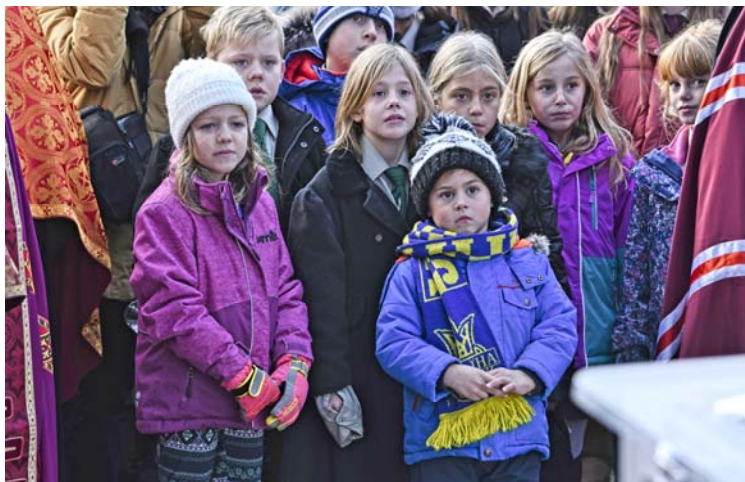
Наймолодші учасники відзначення Голодомору