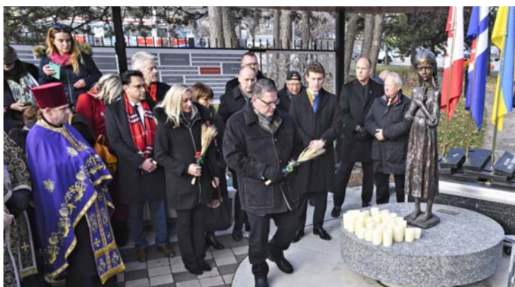
Представники Федерального, Провінційного урядів, м. Торонто покладають пам'ятні колоски